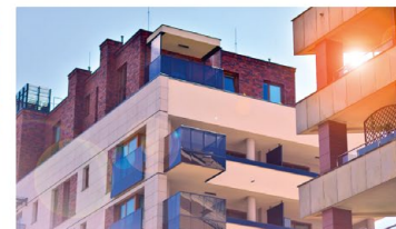
Цена не решает: аналитика рынка недвижимости Ташкента 04.05.2026

Аналитическое исследование рынка недвижимости Узбекистана, проведенное агентством Assalom Estate.